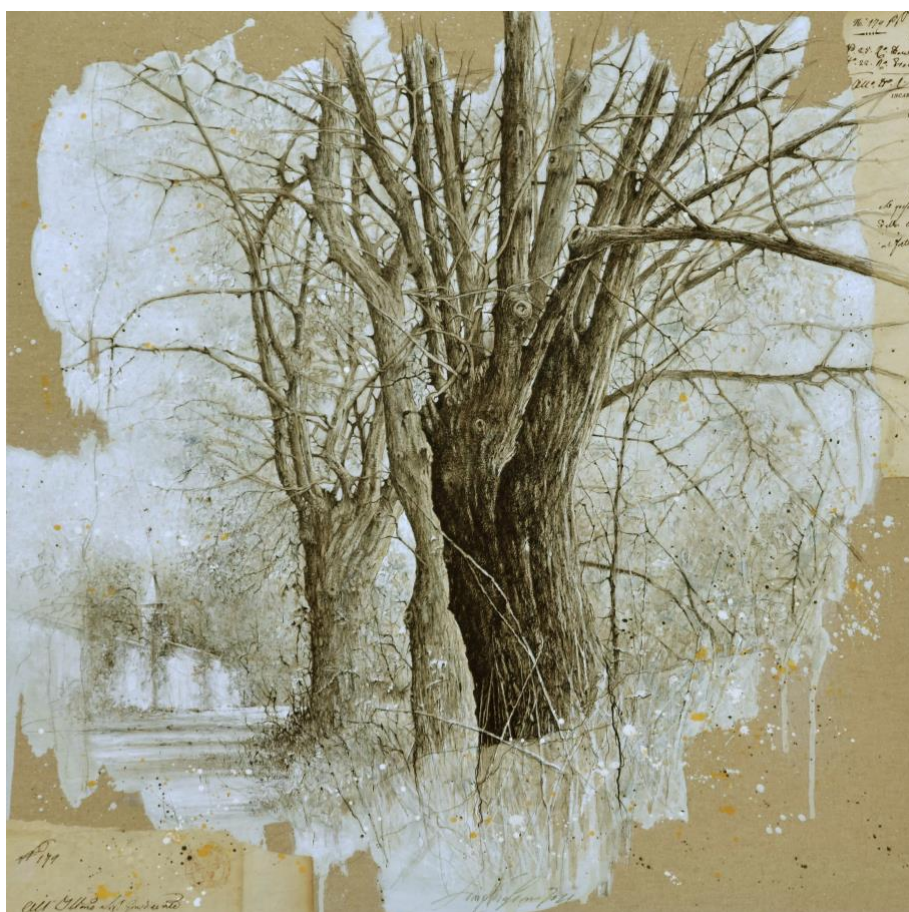
Viale a Cart

Per entrambe le mostre sarà pubblicato un catalogo bilingue ( italiano-francese).