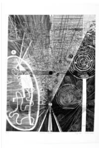
Egide (*1957) Electricité-Verseau , 2001 bulino, mm 560 x 420 © Egide