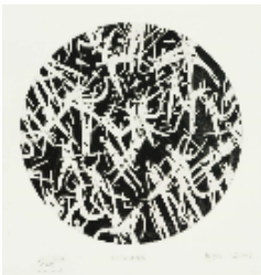
Egide (*1957) Attaques , 2006 bulino su rame, mm 460 x 460 © Egide