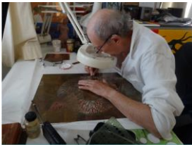
L'artista Egide nel suo studio a Muralto, 2019