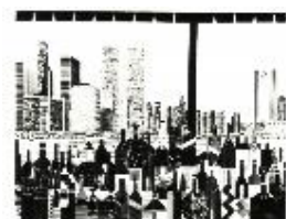
Egide (*1957) Grand River Caffe , 1987 bulino su rame, mm 320 x 410 © Egide / Foto Egide