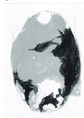
Gianna Bentivenga, Equilibri multipli II , 2023, puntasecca su plexiglass e chine collé , 1000 x 700 mm (foglio) © Gianna Bentivenga