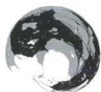
Gianna Bentivenga, Anamorfica II , 2023, puntasecca su plexiglass e chine collé , 700 x 1000 mm (foglio) © Gianna Bentivenga