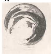
Gianna Bentivenga, Anamorfica , 2024, acquaforte su rame, 380 x 280 mm (foglio) edita dall'AAAC quale stampa n. 120 © Gianna Bentivenga