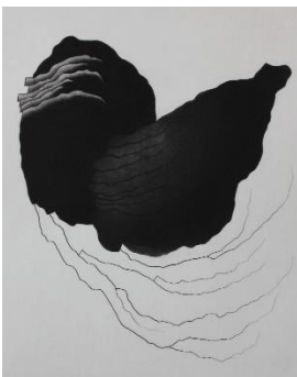
Claude-Alain Giroud (*1948) Sans titre , 2021 manière noire, burin et échoppe, 420 x 340 mm (feuille) © Claude-Alain Giroud