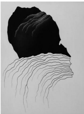
Claude-Alain Giroud (*1948) Sans titre , 2021 manière noire, burin et échoppe, 420 x 340 mm (feuille) © Claude-Alain Giroud