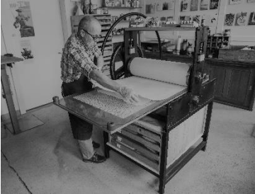
Claude-Alain Giroud al lavoro nel suo atelier