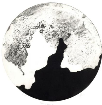
Crystel Ybloux "Face à face II", 2020 maniera nera, lavis su rame, ø 198 mm III Premio AAAC 2020