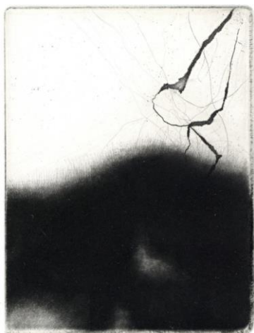
Vittoria Gibin "Intrecci I", 2021 acquaforte e maniera nera su rame, 124 x 93 mm II Premio AAAC 2020