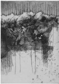
Donatello Laurenti, "Pescatori di scaglie", 2018, acquaforte e acquatina su ottone, mm 126x89 (380x280) © Donatello Laurenti