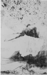
Donatello Laurenti, "Entropia", 2018, acquaforte su ottone, mm 199x125 (380x280) © Donatello Laurenti