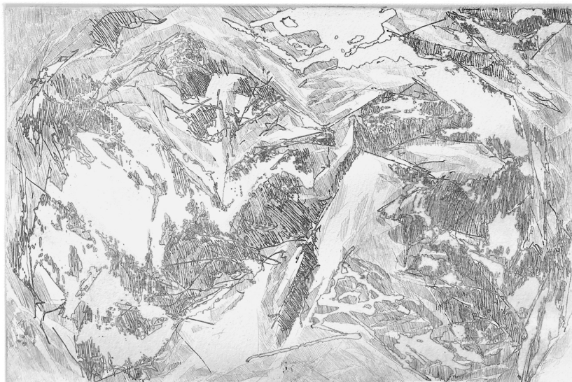
Carla Ferrioli, Stratigrafia (AAAC 125), maniera allo zucchero, prova di stampa prima dell'intervento ad acquaforte, 200 x 300 mm