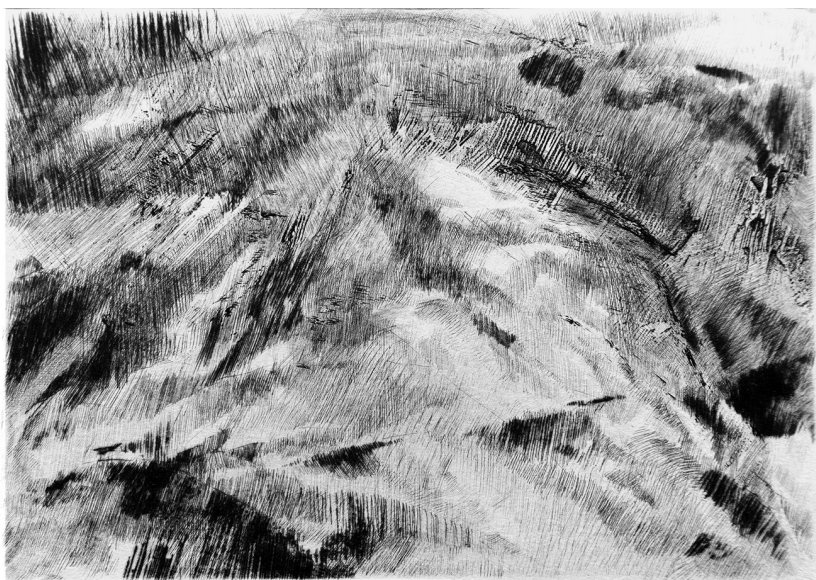
Carla Ferriroli, Variazioni geologiche 8 , tecnica mista in calcografia, 150 x 210 mm