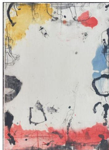
Ai margini 1 , 2012, acquatinta e puntasecca, mm 695 x 490, tre colori, due lastre, P.A.