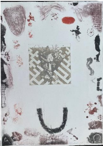
Labirinto , 2012, acquatinta e puntasecca, mm 685 x 490, tre colori, due lastre, P.A.