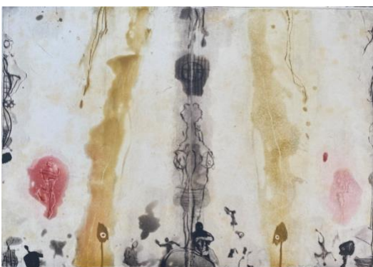
Senza titolo , 2012, acquatinta, puntasecca, mm 350 x 495, tre colori, P.A.