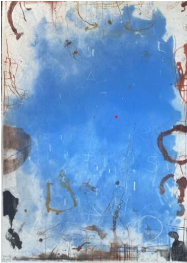
Ai margini 2 , 2012, acquatinta e puntasecca, mm 695 x 495, quattro colori, P.A.