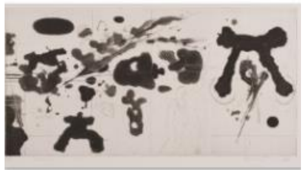
Divenire 3 , 2009, acquatinta e puntasecca, mm 250 x 490, P.A.