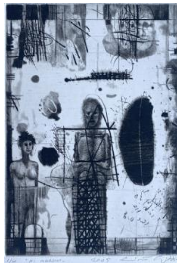
Ai margini , 2005, maniera nera, puntasecca e bulino, mm 250 x 170?, 1/10