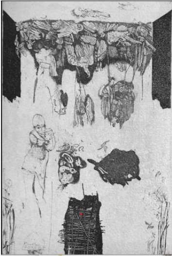
Senza titolo , 2005, acquaforte e acquatinta mm 300 x 200 / 380 x 280 edita dall'AAAC quale stampa n. 114 (riservata ai soci ordinari AAAC) Atelier Calcografico, Novazzano, agosto 2022