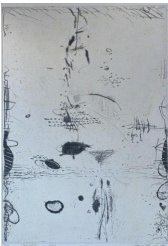
Presenze , 2016, bulino e puntasecca, mm 495 x 350, P.A.