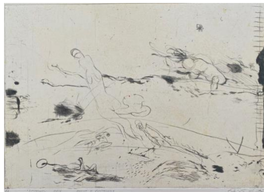
Situazioni , 2016, bulino e puntasecca, mm 350 x 495, P.A.