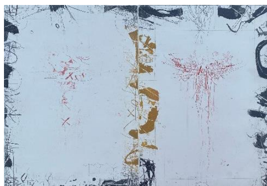
Margini 1 , 2012, puntasecca, mm 345 x 500, tre colori, due lastre, P.A.