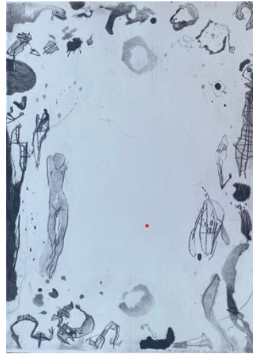
Ai margini , 2014, acquatinta e puntasecca, mm 690 x 495, P.A.