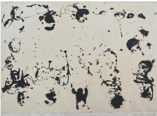
Situazioni 2 , 2019, bulino e carborundum, mm 350 x 495, P.A.