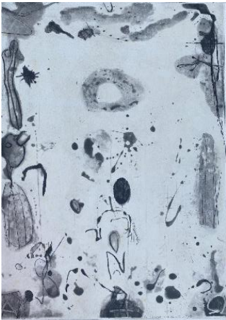
Frammenti , 2014, acquatinta e puntasecca, mm 690 x 495, P.A.