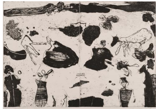
Presenze 2 , 2011, acquatinta e puntasecca, mm 345 x 500, due lastre, P.A.