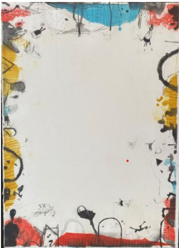
Ai margini 2 , 2012, acquatinta e puntasecca, mm 685 x 495, tre colori, due lastre, P.A.