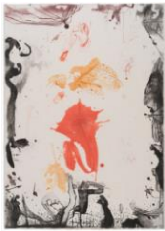
Ai margini , 2018, acquatinta e puntasecca, mm 695 x 495, 3 colori, P.A.