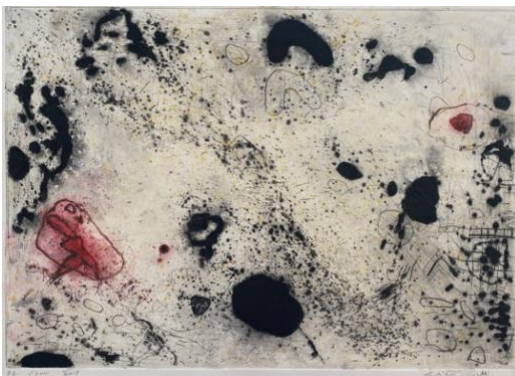
Visioni , 2019, carborundum e puntasecca, mm 350 x 500, 2 colori, P.A.