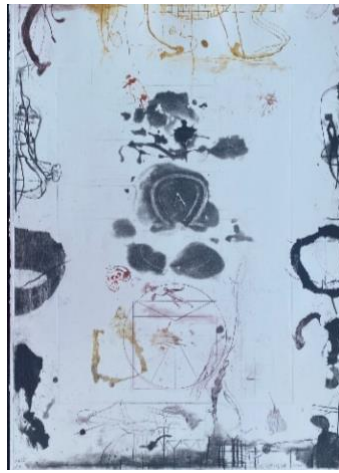
A e Ω , 2017, acquatinta e puntasecca, mm 695 x 495, 3 colori, P.A.