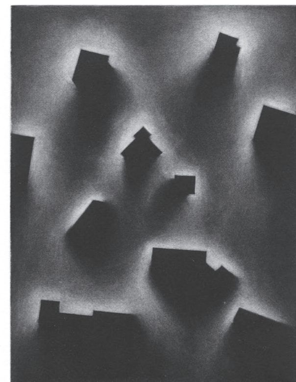
2° premio, Antoine Allaz (CH, *1987) La terre, 2017 maniera nera, rame

Schweizerische Eidgenossenschaft Confédération suisse Confederazione Svizzera Confederaziun svizra